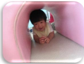
トンネル・マットの山に挑戦！