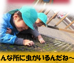
こんな所に虫がいるんだね～

友達との関わりが深まり、積極的に遊びに誘ったり、「〇〇しよう」と提案し、自分達で遊びを進めながら楽しんで遊ぶ姿が見られています。また、玩具の貸し借りの際に保育教諭の仲立ちがなくても譲り合って使うことができるようになってきました。今後も子ども一人一人の話にじっくり耳を傾けたり、友達との関わりを側で優しく見守りながら言葉を使って伝え合う喜びが味わえるようにしていきたいと思います。【言葉による伝え合い】